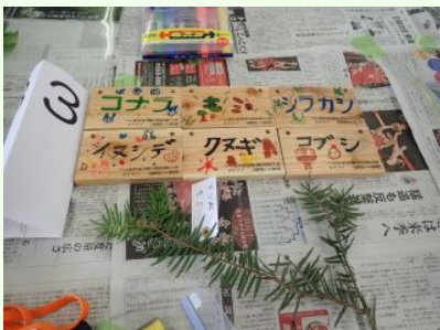
樹木プレート見本 ①