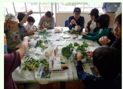
親子での作成風景