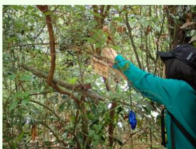
この辺でいいかな？