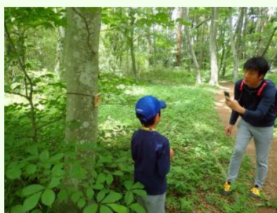
プレート前でハイポーズ！