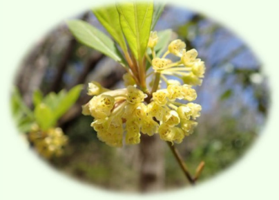
クロモジの花：葉もいい香り