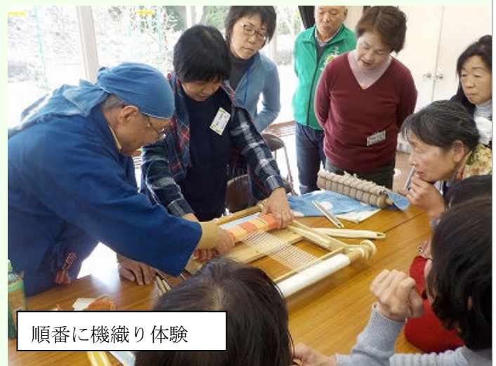
順番に機織り体験