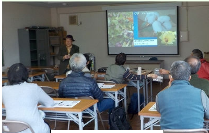
スライドで機織り講義