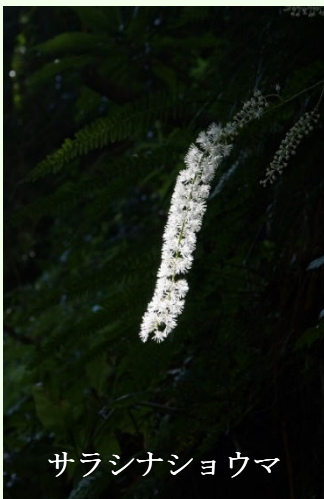
サラシナショウマ