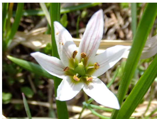
④ 利根運河土手のアマナ