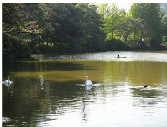
⑥ 理窓公園 白鳥の池