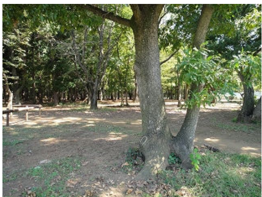
② 東深井古墳の森の入り口付近