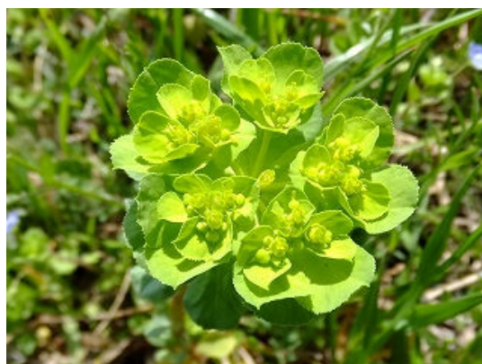
⑤ 利根運河土手のトウダイグサ