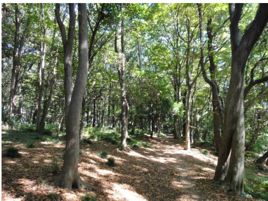
③ 東深井古墳の森 散策路