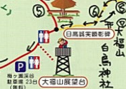
展望台からの眺望