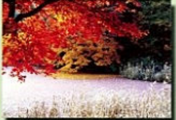
黒川沼のもみじ 川瀬しの紅葉できた三日舟漕