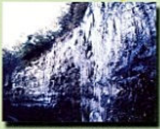
梅ヶ瀬の大壁のつらら (長さ80m 高さ20m)